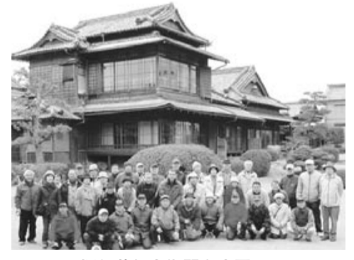
旧伊藤伝右衛門邸庭園にて!