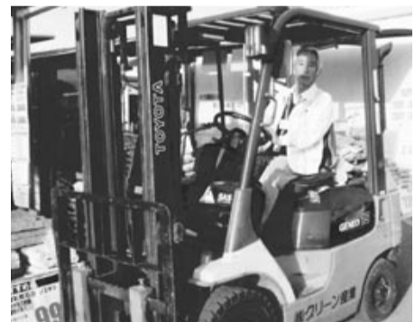
フォークリフトで仕事中

退職後、就職支援センターの紹介でホームセンターに勤めて2年半になります。仕事は1日5時間、月17日勤務で、重量物(ブロック、セメント等)の積み下ろしと外回りの販売です。在職時代と違い、お客様相手で毎日が変化に富み楽しく、また運動不足の私にはトレニングを兼ねた様な仕事なので一石二鳥です。最初は足腰膝などがガクでしたが、1日2万歩目標で取り組んだ結果、今では慣れて職場の主の様です。今後も仕事を楽しみながら健康に努め、職場の皆さんと仲良くやっていきます。