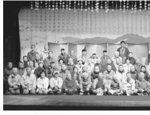
嘉穂劇場の廻り舞台にて!