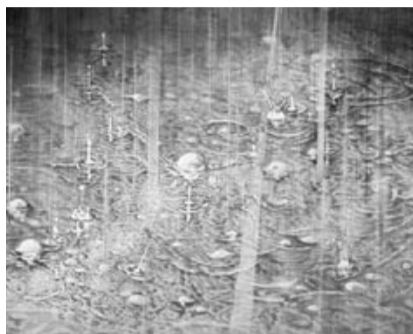
(入選作品)掘割の雨・11月(40号)

室の案内があり、やってみるかと申し込んだのがきっかけです。今年で4年目になるそうです。平成19年度の県展(第63回福岡県美術展覧会)に初めて応募して、製作3ヶ月の40号、掘割の雨・11月の作品が見ごとに入選しました。水彩画の面白さはやってみるとこんな世界があったのかと思う楽しさで、筆を持つと自分の世界に浸れてしまうそうです。今後とも気に入った絵ができれば積極的に公募展に出していきたいという事でした。(福永政治)