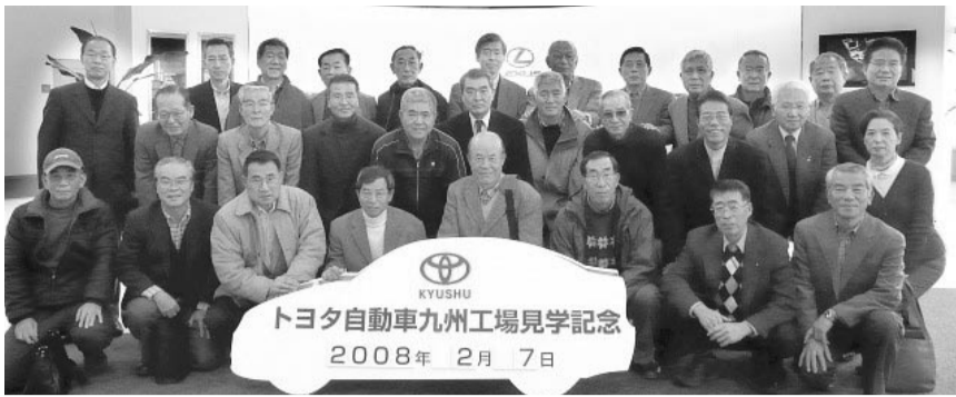
トヨタ自動車九州工場にて(第2回)