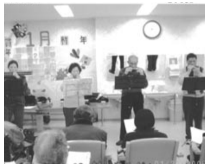
築地さんは写真の右端