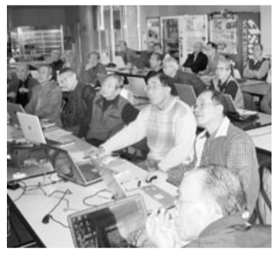
ふーん 便利だなー