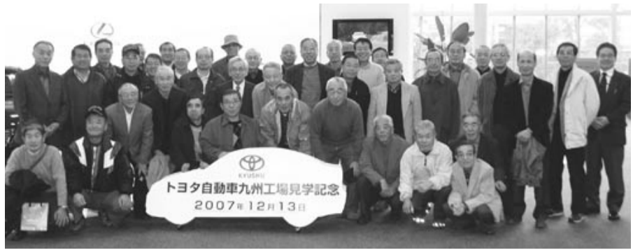
トヨタ自動車九州工場にて(第1回)