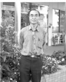
事務局長お勤め ご苦労さんでした