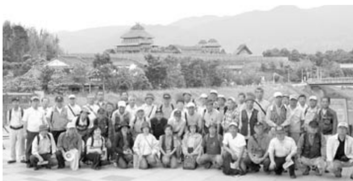
吉野ヶ里歴史公園にて