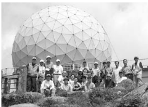
背振山頂ドーム前で

5月30日、吉野ヶ里の東背振農協に集合。帰路の椎原峠に車を1台置き、背振山頂駐車場まで22名が合流。山頂からの展望は黄砂で視界が悪かったが目的地の一つ鬼ヶ鼻石はくっきり見える。キャンプ場から自然歩道を展望台へ。山頂一帯の照葉樹林はひととき美しく山頂のドームが間近に見え、木陰を暫く歩き唐人舞で小休止、その少し先で昼食。休憩後は椎原峠を経て鬼ヶ鼻岩へ。ここでは岩場で腹這いになり絶壁を覗きスリルを味わった。