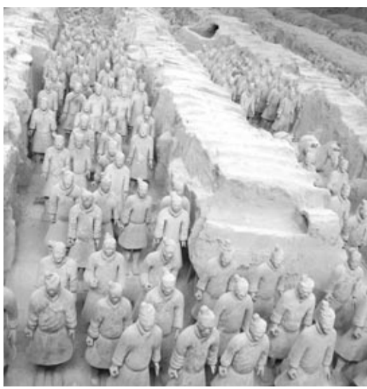
「写真」 兵馬傭(始皇帝)