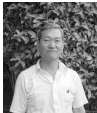
愛犬との散歩で健康増進

ています。朝は5時半に起床、愛犬と一緒に30分、夕方30分、土曜・日曜は1時間実行しています。以前はジョギングもしましたが、体調が悪いと「今日は止めよう」と勝手に判断して3日坊主で終わりました。 それが愛犬と散歩すると、彼にストレスを与えてはダメだと思ふ責任感から長続きします。3日坊主にはなりません! (小野雄史レポーター)