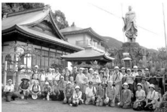
遍照院・弘法大師像前にて

カメラ写真の編集の仕方を中心に、写真の取り込み・フィルムの管理方法等を学び、その後実際の写真の修正・加工(画質調整・回転・切り抜き・合成・傾き)等を演習を交えて実習しました。