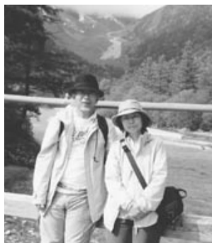
上高地河童橋にて