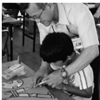
子供たちと一緒に!