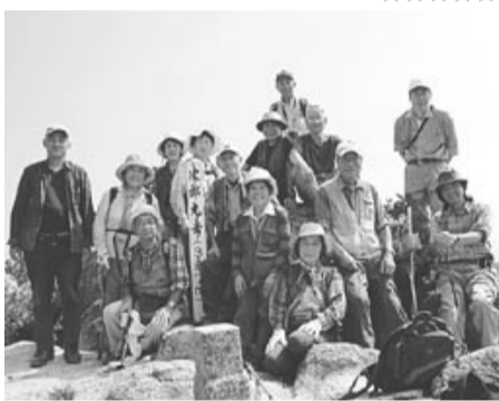
次郎丸嶽～太郎丸嶽へ