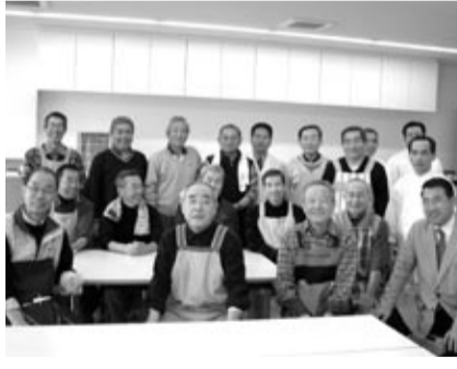
おじさん料理教室のメンバー

お魚料理教室を開催 3月8日粕屋町駕与丁池そばの「サンレイクかすや」で本年度最後の地区行事、お魚料理教室を参加18名で開催。 皆それぞれ持参のエプロンをはおり、互いに見慣れない格好を気にしながら料理長の説明を聞く。 献立は、サバは照り焼きと竜田揚げ、アジは味噌煮、ミンチのみれ汁と刺身です。早速4班に分かれ料理人の手本をまね包丁を入れますが、思ったように動かし、刺身におろすつもりが包丁が進むに連れて段々とミンチにしか使えなくなり結局、刺身料理は料理人さんに任せてしまいました。