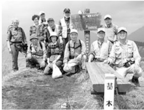
阿蘇・清栄山山頂にて

登山 阿蘇の展望台・清栄山へ 3月31日、高森峠のトンネル前の駐車場に車を置き、旧高森峠の廃道となった暗いトンネルをくぐる。しばらく下って左の林道(九州自然歩道)へ入り、草原状の牧場へ出ると、脇道に希少植物の「翁草」が数輪咲いている。 カメラに納め、最後の急登を喘ぎながら登り詰め頂上に立つ。目の前には阿蘇・根子岳の特異な山容が迫ってくるはずだが、黄砂の影響か、霞んで全くNG。風も強く陽だまりで食事を済ませ下山。参加11名。(藤井哲夫)