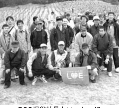
PCC現役社員といっしょに

3月10日、海の中道海浜公園での松苗植樹ボランティアに参加しました。九会より9名が参加しました。 これはボランティア団体「はかた夢松原の会」が、環境保護、砂防景観保護などの観点から20年間で3万2千本の松苗を植え続けられているもので、当日は参加者約200名(PCR現役社員も20名参加)といっしょに2000本を植樹しました。 貸切バス4台で天神日銀前から雁ノ巣駐車場に行き、普段は出入禁止の国有地の日本海側海岸線に到着。 植樹方法の説明の後、砂丘のような斜面の植樹予定区画に一人10本のペースでスコップでの穴掘り、栄養土、苗、肥料の順に入れ一本づつ補強竹に紐で結びました。傾斜地で足場が悪く、重たい土運びや苗土のほぐしに悪戦苦闘しながら、最後は全員のバケツリレーでの水やりは途中で小雨が降ってきて中止。 思った以上にハードでしたが「15年もすると立派な松の木になりますよ」との話を聞いて参加の意義を学び貴重な体験となりました。